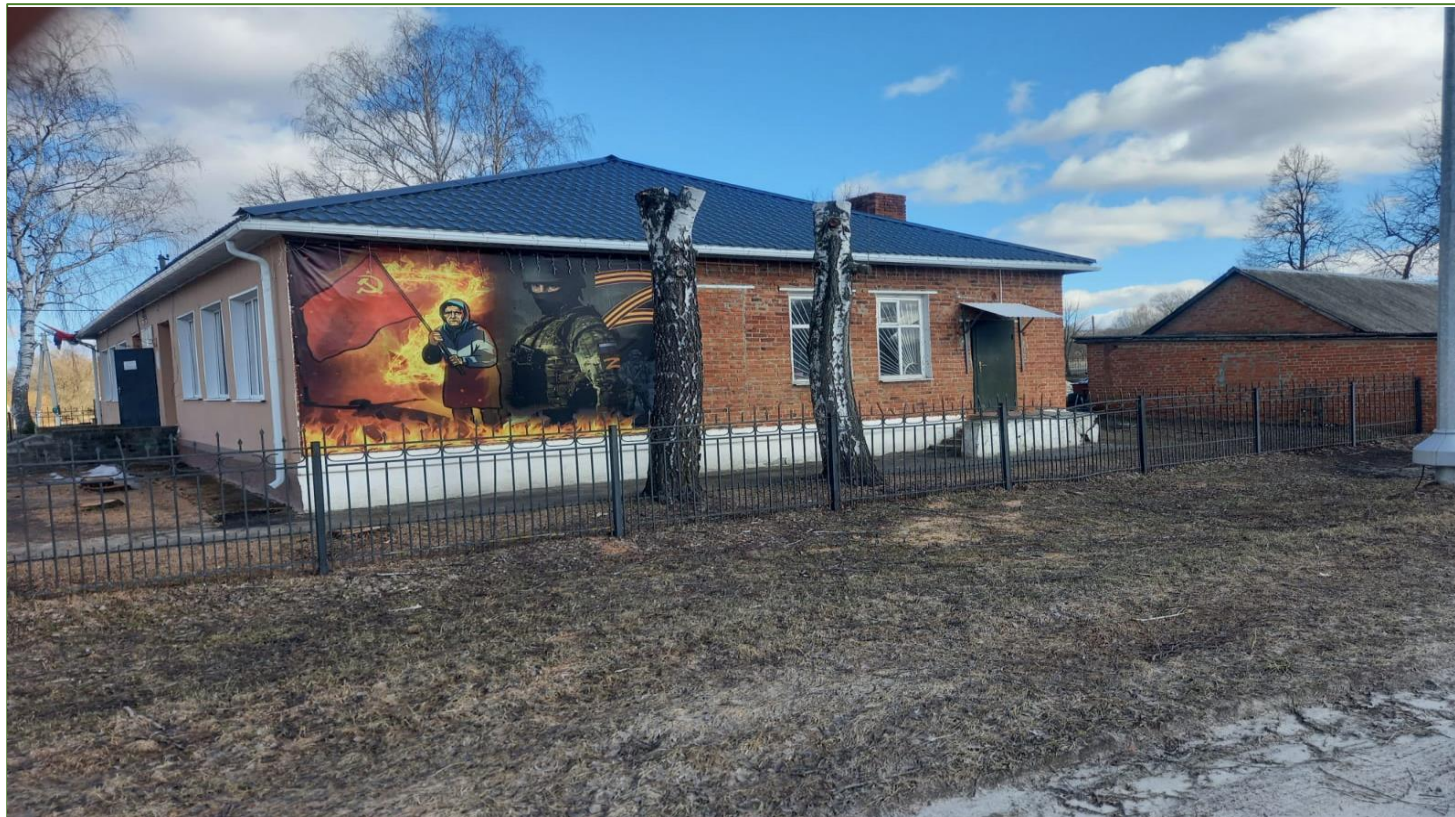
Нежилое помещение в здании с кадастровым номером 31:14:0406015:59, расположенное по адресу: Белгородская область, Борисовский район, с. Крюково, ул. Ленина, 55