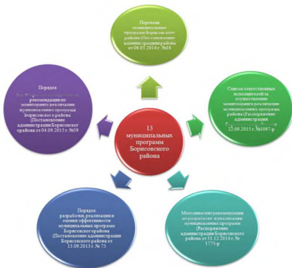
Рис. 2. Нормативная правовая база по вопросам разработки, реализации и оценки эффективности муниципальных программ района

В соответствии с Федеральным законом от 28 июня 2014 года №172-ФЗ (с измен. 31.07.2020 г.) «О стратегическом планировании в Российской Федерации», законом Белгородской области от 3 ноября 2016 года №106 «О реализации в Белгородской области некоторых положений Федерального закона «О стратегическом планировании в РФ» и принятой муниципальной нормативной правовой базой, регламентирующей разработку, реализацию, оценку эффективности реализации муниципальных программ (рисунок 2) отделом экономического развития и труда администрации Борисовского района совместно с управлением финансов и бюджетной политики администрации Борисовского района, осуществляется мониторинг реализации муниципальных программ района.